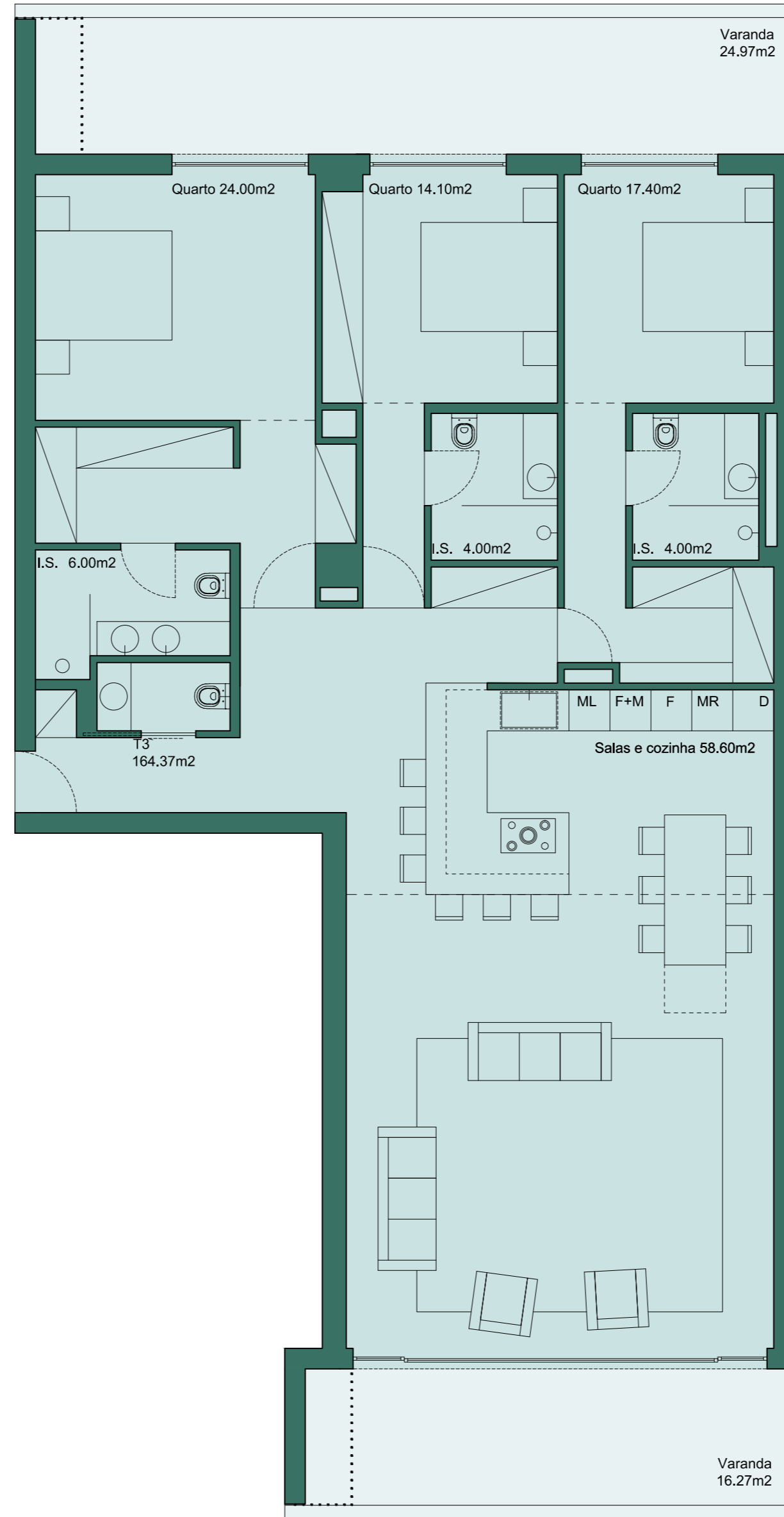
Planta piso 1